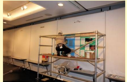
展示もずいぶん、慣れてきました