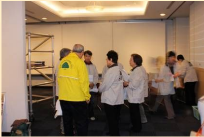
まずは、作戦会議から・・・