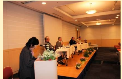
コミュニケーションタイムのようす