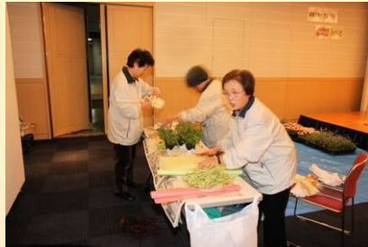
会場を花で飾ります♪