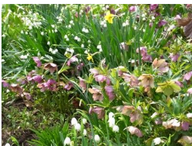
スイセンとクリスマスローズ