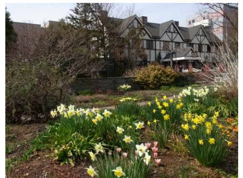
今回のガーデンの主役はスイセンでした！

3月18日(木)、群馬県にあります「アンディ&ウィリアムボタニックガーデン」「フラワーガーデン泉」を見学するバス研修を行いました。34名の参加があり、本格的イングリッシュガーデンを散策して春の訪れを待つガーデンを堪能し、バスの中での交流も楽しく過ごせた一日でした。