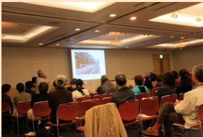
まちあるきのレポートもしました

3月13日(土)環境フォーラムが開催されました。入場者はスタッフ含めて130名。今年も多くの方にご来場いただきました。