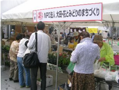
とてもいい場所でPRできました！

【10/16-17 おおた商い観光展 2010に出展】大田区産業プラザPiOにて開催された「おおた商い観光展」に出展、羽田空港の国際化を翌週に控え、例年以上のにぎわいを見せたイベントになっていました。当会は1階の「商いゾーン」の正面入口のテントで、主に圃場で育てたパンジー、ビオラ苗を販売しました。今年はテントの場所がよく、売れ行きも上々で、初日で7割ほどの苗が売れました。(報告:藤澤久美子)