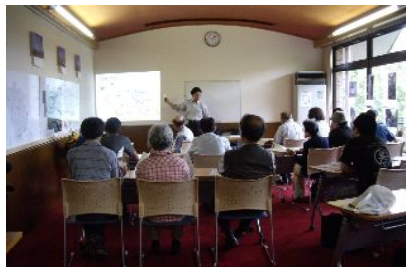
大橋係長による講演会は盛況！

【10/16-17 第38回大田区生活展】上記と同じ日に、大田区消費者生活センターにて開催された「大田区生活展」に参加しました。他のイベントと重なったせいか例年に比べ入場者が少ない感じでしたが、「昨年買った苗にたくさん花が咲きましたよ」「初めてだけどうしたら・・・」「ytt(イエスタデイ・トゥデイ・トゥモロウ)ってなに」など対話を楽しみながら、思ったよりたくさん販売することができました。(報告:荻野博子)