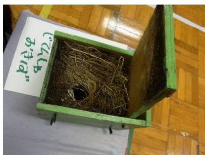
スズメが巣作りした形跡に大喜び

【10/6 洗足池児童館 巣箱はずしイベント】洗足池公園の中にある児童館で、毎年この時期に、公園内に取り付けた巣箱を回収し、洗浄して翌春の鳥の子育てのために取り付ける、という活動を、10年以上続けています。当会でサポートを始めて今年で7年目。5年前からは、民生委員の方たちにもお声をかけていて、地域に楽しみにしてくださっている方も増えてきています。回収した7つの巣箱すべてに営巣の痕がみられ、参加した30名の子どもたちと興奮！のひと時を過ごしました。11月には取り付けイベントを開催します！(報告:牧野ふみよ)