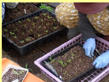
大森南圃場でのポット上げ

遅まき(9/15)の方からも、同じようになったという声を聞き、同時に半分以上、発芽から本葉へと育ったという人もいました。どこが、何が違うのでしょうか？ 皆さんのご意見もお聞かせください。今回、うまく発芽しなかったという方もこれに懲りずに、次回もご参加ください。