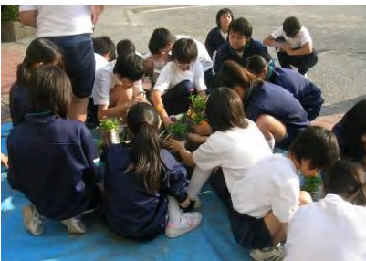
今回はペットボトルを新調♪

【蒲田中・植栽活動サポート】 11月8日(月)、7月と同様にペットボトルに花苗を植えたものを香川のフェンスにかけるときの活動のサポートを行いました。圃場で育てたパンジー・ビオラを120株植えつけ、しばらく校内で養生してフェンスにかけたあとは、生徒たちのボランティア活動で水やりなどの手入れを行います。地域からも楽しみにされている息の長い活動のお手伝いができることは嬉しいですね。(報告:牧野ふみよ)