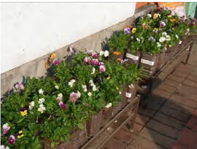
そろそろ香川に飾られている頃？

【蒲田中・植栽活動サポート】 11月8日(月)、7月と同様にペットボトルに花苗を植えたものを香川のフェンスにかけるときの活動のサポートを行いました。圃場で育てたパンジー・ビオラを120株植えつけ、しばらく校内で養生してフェンスにかけたあとは、生徒たちのボランティア活動で水やりなどの手入れを行います。地域からも楽しみにされている息の長い活動のお手伝いができることは嬉しいですね。(報告:牧野ふみよ)