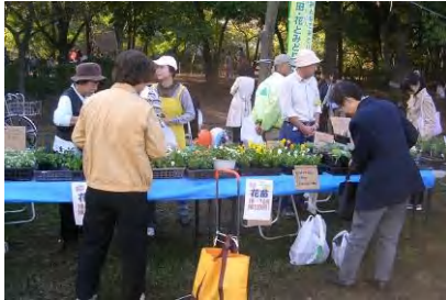
いいお天気！イベント日和でした。

【OTA ふれあいフェスタ】 11月6(土)・7日(日)、区の一大会に参加しました。秋晴れの気持ちのよい日、「緑のエリア」の平和の森公園は多くの人でにぎわいました。例年通りテントを借りて、花苗販売と寄せ植え体験コーナーを設けましたが、圃場で育てたパンジーが特によく売れて、1日目から圃場に追加分を取りに行くほど。2日間で会員の参加は延30人、売り上げは148,250円。圃場で育てた花苗は803本販売しました。大変盛況で楽しくやりがいのある2日間でした。