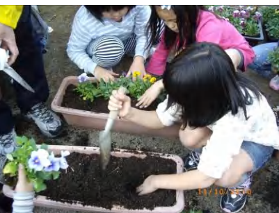
土いじりを楽しむ子どもたち

【洗足池児童館・巣箱取り付け】 先月取り外した巣箱をきれいに洗って春の野鳥の子育てのために巣箱を取り付ける活動を11月10日(水)に行いました。児童館の子どもたち約40名と、地域の民生委員の皆さんとで巣箱を取り付けた後は、公園で「シジュウカラの子育てゲーム」をして楽しみました。このゲームはシジュウカラのヒナが何を餌にするかが分かる、学習ゲームになっています。来年の秋に、また営巣の成果を確かめるのが楽しみです。(報告:牧野ふみよ)