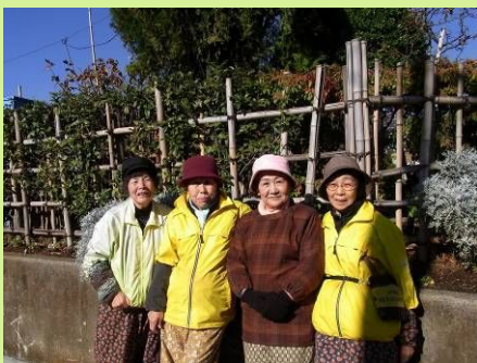
大森南圃場でお待ちしてま〜す！

【大森南圃場 花苗育成チームの皆さん】駅前花壇や保育園・児童館の庭に植えたり、イベントでの無料配布や廉価販売をしたりと、当会のメンバー自らの手で育てた花が、区内各所で咲いています。1シーズンで15,000株ほどの花苗が育成されますが、これらは、当会が管理するふたつの圃場で育てられています。今回は大森南圃場で明るく楽しく花苗を育てている女性陣の声をご紹介します！