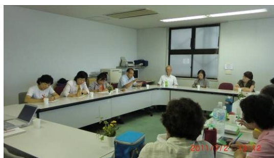
互いの知恵に聴き入りました