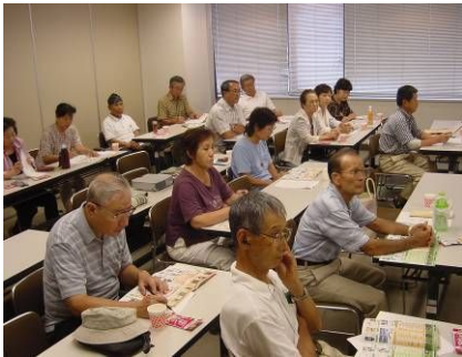
かなり昔の写真ですが、皆さんの表情は真剣！こんな風景を目指して…

先月号の会員だよりで募集しました「すみれ塾」の企画運営チームですが、現在、2名の方がエントリーくださっています。(現在も募集中です！)これから、内容を詳細に詰めていきますが、現時点で計画している内容について、少しご紹介させていただきます。