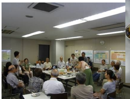
和やかで楽しく集いました

嬉しいことに今年度は14名の新会員を迎えられました。これを機に新旧会員みんなで、改めて会について知り合おう、という目的で、交流会を開きました。23名(新会員7名)の参加で、当会の組織・活動・目標などを確認、理解するよい機会になりました。第二部では、区民農園共同区画等で収穫した野菜や梅の料理やジュースに舌鼓を打ちながら(ここが肝心!)それぞれの思いを語り合うこともできて楽しいひとときでした。ネ。。。(内田秀子)