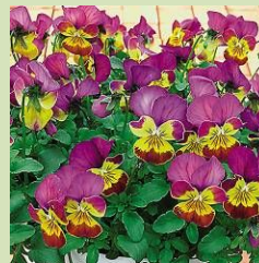
ビオラ「あいちゃん」