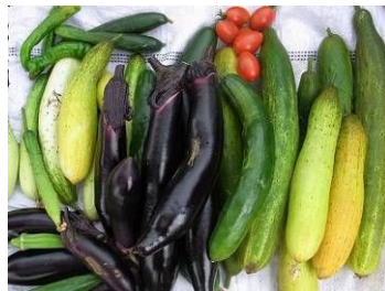
こんな野菜が採れています