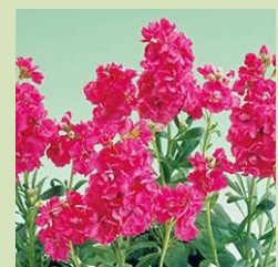
ストック「キスミー サーモン」