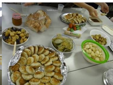
おいしいのが何より！