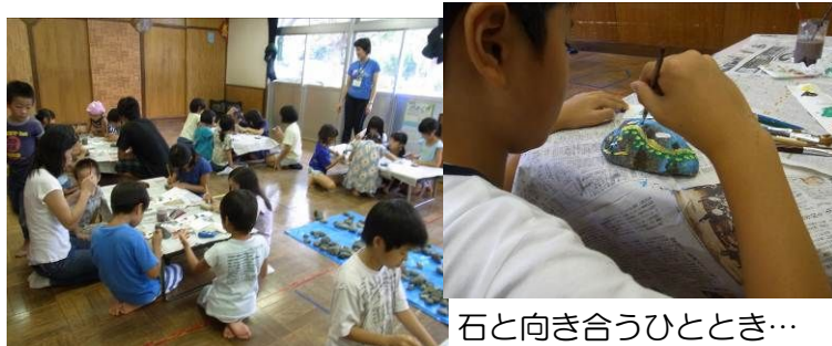
石と向き合うひととき…

約50名(!!!)もの子どもたちが、ブルーシートの河原に並んでいる石ころを各自拾ってくるという演出からストーンペインティングは始まりました。最初のひと筆をそ〜と描く子、最初から何も考えずにとにかく色をペタペタ塗る子、この時のために絵を用意していた子と様々。それぞれがだんだん石ころの形と図案を考えて作っていきます。ひとり3個の作品にみんな楽しかったと大喜び。中でも、一つの石だけを使って龍の絵を描いた子が「何を描こうかじっくり考えてから取り組んだ」との言…その作品の素晴らしさに先生たちも驚きましたが、彼は日頃自分から話すことをしたことがないそうでどうやらペインティングが心を動かしたよう。子どもたちのエネルギーが何故か心地よい清涼感を残してくれました。(内田秀子)