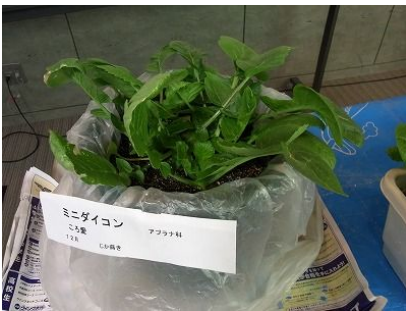
↑植木鉢+保温ビニールで、冬でもダイコンづくり 2月の「ベランダでの野菜栽培講座」より

今、巷ではちょっとした都市農園ブームが起こっています。特に震災後、自家菜園で野菜を作る人が増えているようです。大田区には私たちが管理している2つの区民農園を含め、全部で6つの区民農園がありますが、残念ながらどこも応募者が殺到し、なかなか利用できないのが実情です。