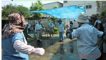
ラジオ体操開始! 今日も頑張るゾ!!