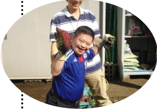
大森東福祉園の畑で育てた サツマイモの収穫

この事業では区内福祉施設にある花壇の手入れや畑の作業を継続的に行う活動のほか、福祉団体が「ふれあいパーク活動」(区内公園の清掃や花壇管理)などを行う際の運営アドバイスや技術指導など、サポート事業も行なっています。