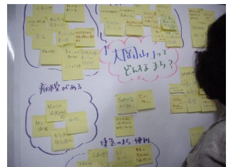
魅力ある大岡山を再発見した ひとときでした。