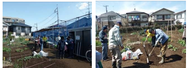
講座終了後、みんなで6月のオープンデーで収穫するジャガイモを植えました。