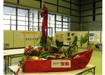
上: 「レガートおおた」、「だんだん」、「く〜の東北」出店 下: 今年も野菜満載の手作り宝船