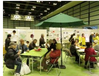
上: 区民農園・高校・福祉園で 収穫した野菜展示 下: カフェレガートによるフェア トレードコーヒーコーナー