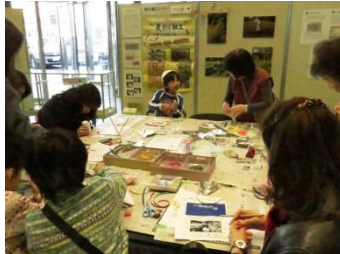
大田ユネスコ協会「麦わら 細工体験コーナー」