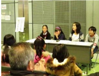
東蒲小学生によるミニ講座 「今も生きている六郷用水」

大田区産業プラザ PiO 大展示室で「第65回野菜と花の品評会」と同時開催されました。今年の収穫祭は新たに参加した区民グループが会場を盛り上げてくれました。