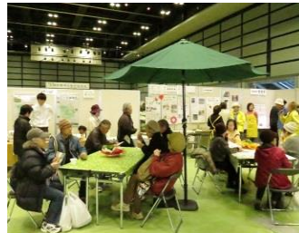
上: 区民農園・高校・福祉園で収穫した野菜展示 下: カフェレガートによるフェアトレードコーヒーコーナー