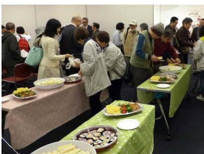
ランチタイム交流会