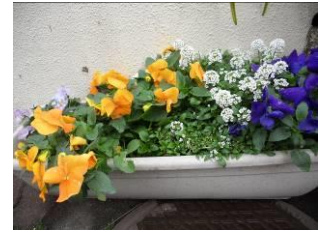
嶺町文化センター