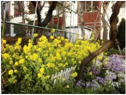
大森西特別出張所