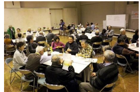
グループワークの白熱討論風景

グループごとに、実行委員会メンバーから、進行役を決め、まずはどのテーマについて話し合うかを決めて、グループごとにテーマを発表。その時点で、自分が「どうしてもあちらのグループのテーマに参加したい」という方には、移動をしてもらったタイミングも設けました。そうした進行方法については、事前に開催された実行委員会で検討していましたので、大変スムーズに進行しました。その後、話し合いの様子を、各グループから発表してもらいました。