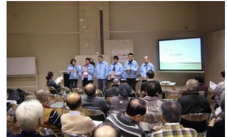
「みどりの歩み」の活動紹介のようす

今年で14回目となった環境フォーラムでは、午前中の活動紹介に続きその後のコミュニケーションタイムとして、「グループワーク」を企画。各団体からの参加者と、当会スタッフも含めて、総勢50余名が5つのテーブルに分かれて、実行委員メンバーによって、当日検討された7つのテーマの中から1つを選び、90分間話し合いました。