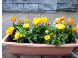
川端自治会事務所