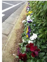
道々橋まほろば公園