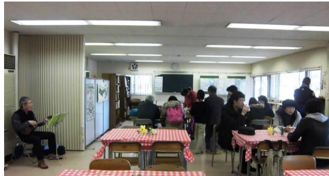
3/5(日)「ひな祭りカフェ」&「手しごとタイム」