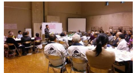
グループトークの発表風景

グループごとに、実行委員会メンバーから、進行役を決め、まずはどのテーマについて話し合うかを決めて、グループごとにテーマを発表。その時点で、自分が「どうしてもあちらのグループのテーマに参加したい」という方には、移動をしてもらったタイミングも設けました。そうした進行方法については、事前に開催された実行委員会で検討していましたので、大変スムーズに進行しました。その後、話し合いの様子を、各グループから発表してもらいました。