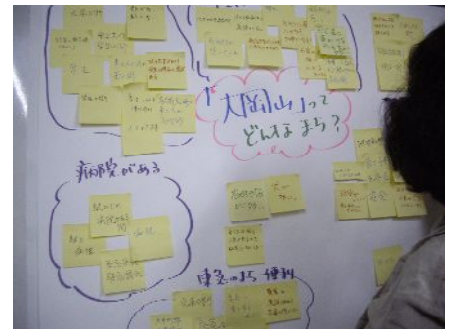
魅力ある大岡山を再発見した ひとときでした。