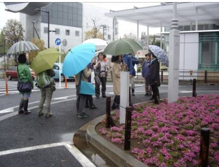
3/25に植えた芝桜が こんなにきれいに咲いていました。

この花壇づくりとその後のメンテナンスを地域の人たちが主体的に担っていくために、みんながそれぞれの思いを実現できるように、また共有できるようにしていくために ワークショップ （体験型講座）という形式で進めていきます。しかし、当会ではワークショップという手法で花壇づくりを進めることは未経験です。そこで、今回はすでにワークショップでコミュニティガーデンをつくることに成功事例をもっているNPO法人 グリーンワークスから私たちも手法を学び、今後の花壇づくりにも活用していきたいという新たな試みに挑戦します。