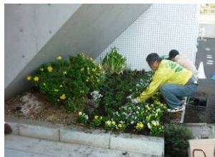
↑ 午前中は雪谷保育園で花壇づくり