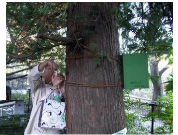
巣箱の取り付けの後は、鳥の巣箱での子育てにちなんだゲームもしました