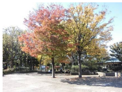
11月の縁側前の風景

みどりに囲まれた平和の森公園の中でひと際モダンな建物(通行する人の言葉)で「みどりの縁側」(区の正式名称は「緑の展示室」)をオープンして7カ月が経ちました。現在来館者は月平均300名です。スタッフ会議・来館者からの意見を基に運営のあり方を模索し日々進化を遂げています！