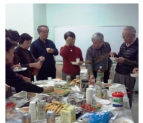
前回の交流会の様子