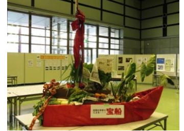
上: 「レガートおおた」、「だんだん」、「く〜の東北」出店 下: 今年も野菜満載の手作り宝船