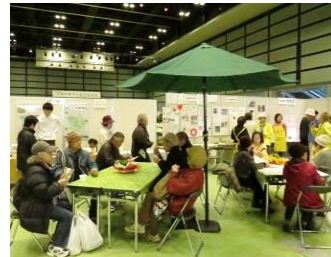
上: 区民農園・高校・福祉園で収穫した野菜展示 下: カフェレガートによるフェアトレードコーヒーコーナー