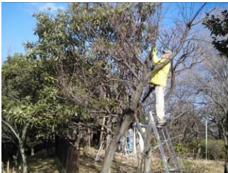
↑ 梯子に乗って剪定作業中!