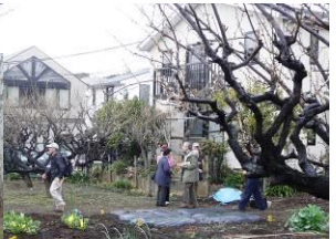
↑ 南馬込五丁目区民農園