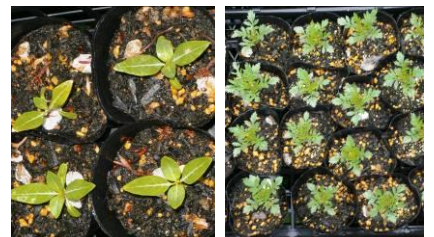
↑4/21現在の苗の生育状況 (左: 日日草 右: マリーゴールド)