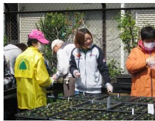
↑ポット上げの様子

4/9(水)大森南圃場、4/11(金)南久が原圃場で春～夏の花壇に植える苗のポット上げを行いました。