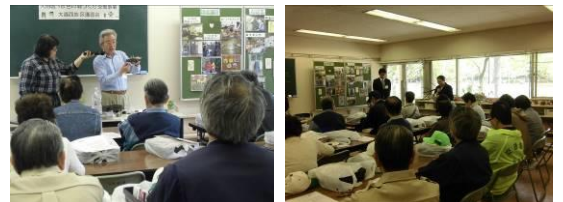
↑大森西特別出張所地域ではコスモスを育てます