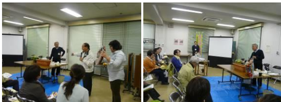
↑羽田特別出張所地域ではビオラ・キンセンカを育てるための予行練習として、マリーゴールドを育てます

4月より区内各地域において「地域の花」の育成を通して「みどりのまちづくり」に取り組まれる地域の方々を応援する事業がスタートしました。当会は「地域アドバイザー」として花を種から育てる育成方法や注意点を助言しています。花づくりは「人づくり・地域づくり」という思いで今後も各地域の力になる体制を組んでいきます。