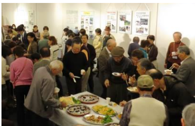
↑ ランチタイム交流会