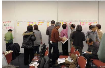
↑ いいね！私のイチ押しタイム