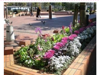
↑ 大森駅前広場花壇