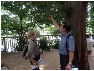
メタセコイアの木

大田区は海、川、丘、平地と環境に恵まれ、都内でも有数の野鳥、昆虫の楽園だそうです。こんな楽しい観察会でしたが参加者が少なく、本当に残念に思いました。(武藤昭紀)