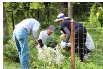
みどりの縁側、バタフライガーデンにて(9/13)