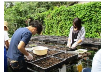
南久が原圃場にて(9/15)