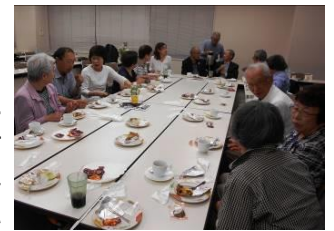
交流懇親会の様子

NPO法人 NPO birthは西東京市いこいの森公園及び周辺の市立公園の指定管理者の一員として、「市民と地域と共に育てる」「市民の立場に立ち、市民満足度を向上」「公園の潜在能力をフル活用した魅力ある公園管理」を重視するなど、常に時代を先取りして私たちに見習うべき姿を示してくれています。