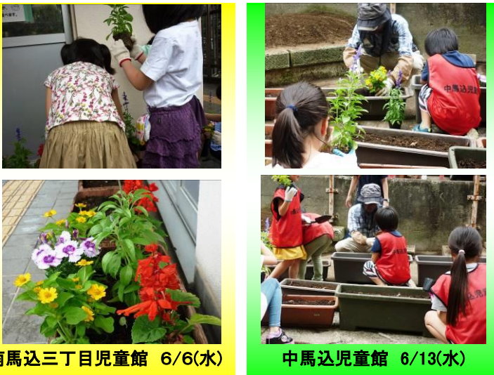
南馬込三丁目児童館 6/6(水)