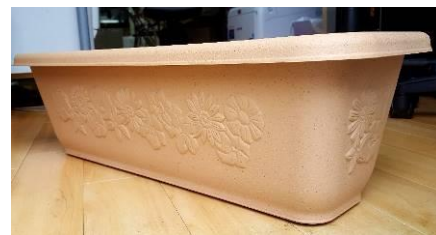
N シャンティ 65 型(12L) (株)リッチェル

数に限りがありますので、ご希望の方は必ず事前に事務所に連絡の上、在庫をご確認ください。