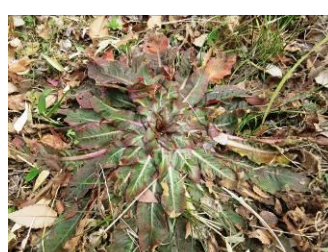
ヒメマツヨイグサ