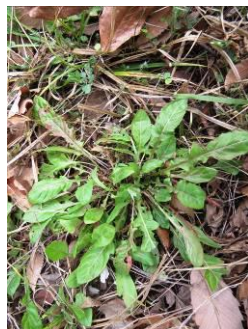
カントウタンポポ