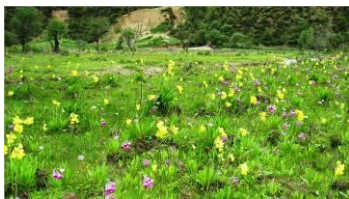
黄色のサクラソウ

最後に、今回の講演の中で最も印象に残ったのは、東アジアで生まれ育った様々な花色のサクラソウが、西端のヨーロッパに旅したサクラソウは黄色が基本であり、東に旅したサクラソウはピンクが基本で、日本に黄色の自生種はないとのこと。できれば雲南省に見に行きたいと思ったのは、参加者皆の気持ちではないかと思いました。(谷文枝)