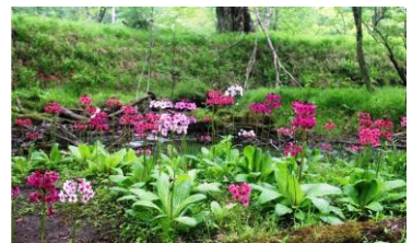
ピンクのサクラソウ