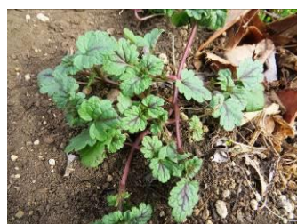
ヒメオドリコソウ