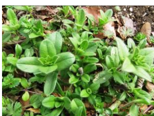
オランダミミナグサ