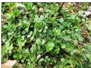
カラスノエンドウ