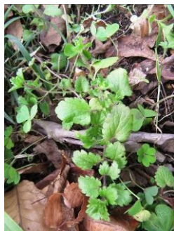
オオイヌノフグリ