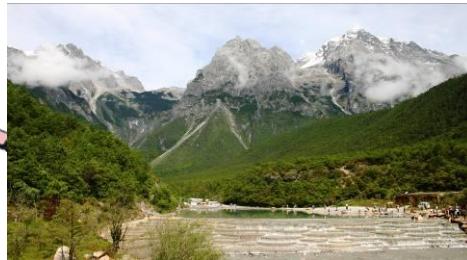
中国横断山脈 雲南 玉龍雪山