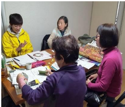
4/9(火)蒲田花壇リーダー ミーティング(当会事務所)