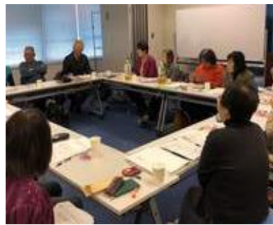
4/11(木)運営委員会・研修 (社会福祉協議会4F 会議室)