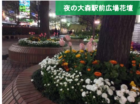
夜の大森駅前広場花壇