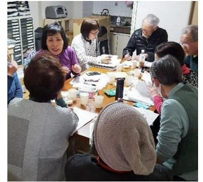
4/5(金)花苗調整会議 (当会事務所)