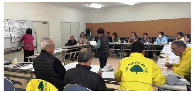
4/16(火)蒲田花壇ミーティング (UR 蒲田本町一丁目団地集会室)