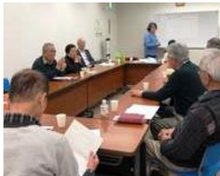
4/2(火)正会員ミーティング (入新井会議室)