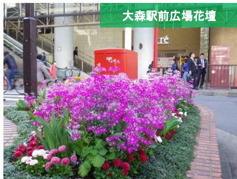
大森駅前広場花壇