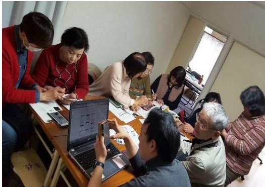
3/19(火)スマートコミュニティアイ講習会 (当会事務所)

ことができるよう各々のスマートフォンを設定しました。レポートを登録するとき、写真に加えて任意のメモを追加することが可能で、また、撮影日時と緯度経度情報も、それぞれ個別のデータとして自動的に登録されます。)が実施されました。それらの様子をご紹介します。