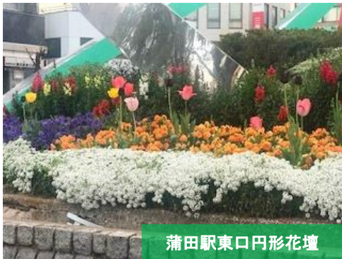
蒲田駅東口円形花壇

三寒四温を繰り返し、ようやく訪れた暖かい季節に花壇は今まさに花盛り。まるで競うかのように次々と開花し、思わず足を止めて深呼吸したくなります♪ そんな花壇の様子をごく一部ですが、ご紹介いたします。是非現場を訪れて、皆さんも春を満喫してくださいね! まだほかにもたくさんの写真が当会ブログにアップされていますのでそちらもご覧ください。 https://blog.canpan.info/npogc/