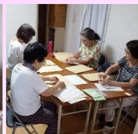
封筒に宛先のラベルを貼り...