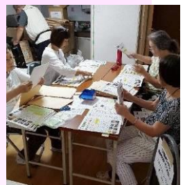
セットした発送物を封入し...