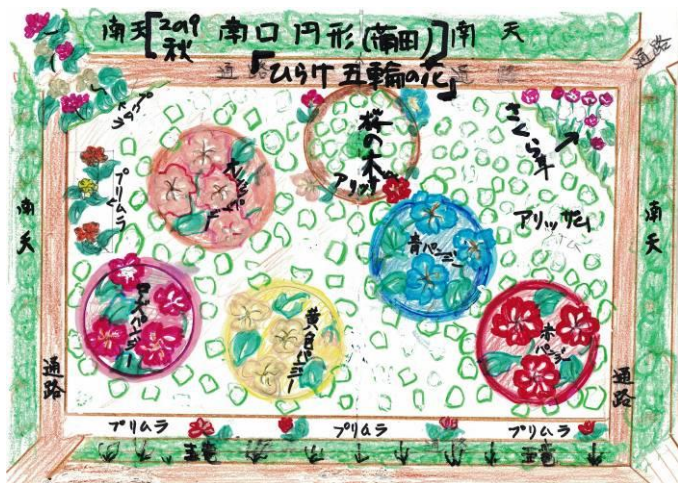
蒲田駅南口花壇「ひらけ五輪の花」

この春、突然のデザイン考案の話を受けました。「寝耳に水」とはこのこと。それも駅前の大きな円形花壇でした…清水の舞台から飛び降りる気持ちでチャレンジしました。仕上げは花が咲き始めてからのお楽しみ!