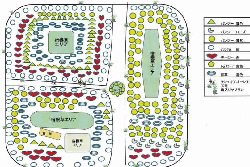
入新井公園花壇「お花が楽しめる憩いの花壇」