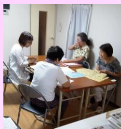
発送物を10枚ずつに分けてセットし...

チラッとでも興味を抱いてくださった方、ご協力いただける方、ご連絡ください。お待ちしております!(事務局)