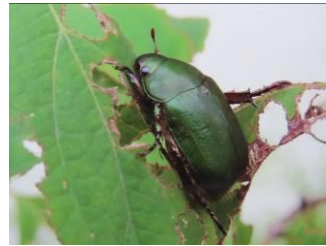
ヤマトアオドウガネ