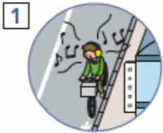
音楽を聴き「ながら」

私たちの生活に便利な“自転車”。 気軽に利用できる一方で、最近では交通ルールやマナーに関する問題が多く取り上げられるようになりました。 一瞬の気の緩みが大きな事故に繋がってしまいます。自転車を利用するときにはくれぐれもご注意ください。