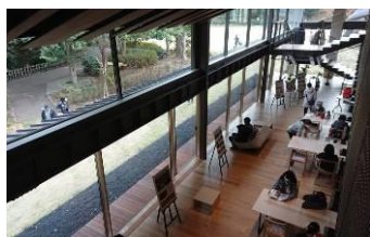
↑2階から見た休憩スペース ←奥にはキッズスペースも。全ての家具も隈氏の設計。