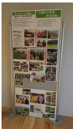
↑せせらぎグリーンメイト力作のポスター展示も必見！