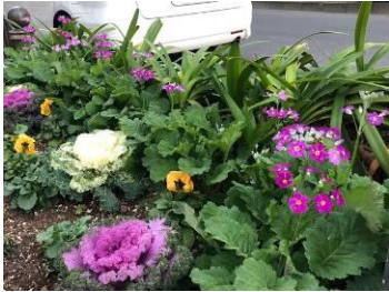
蒲田駅東口あやめ橋