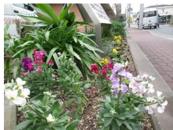
特別養護老人ホーム粧谷