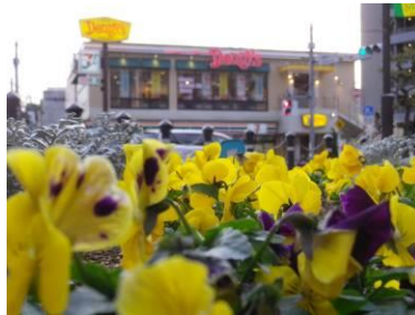
八幡通り入口交差点花壇