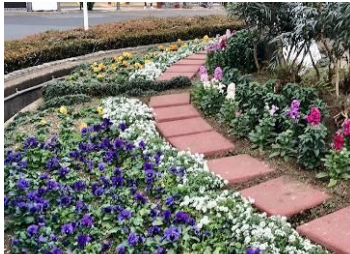
蒲田駅東口円形花壇