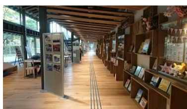
↑紀伊国屋書店によりセレクトされた図書が素敵に並ぶ「せせらぎ文庫」