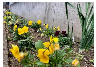
かまた生活支援センター プシケおおた