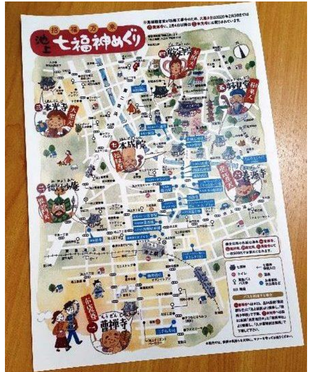
池上七福神めぐりMAP