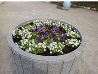
西蒲田五丁目青葉児童公園