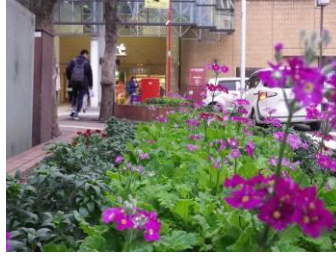
大森駅東口駅前花壇