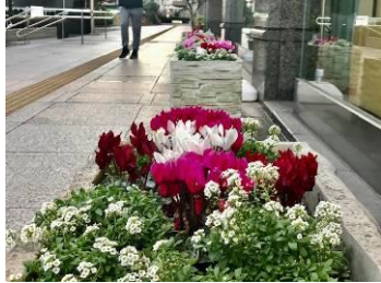
(上・左)大田区役所 本庁舎前花壇