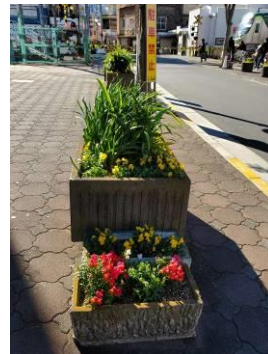
下丸子: 区民プラザ前花壇