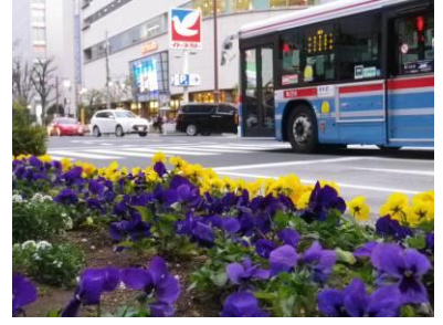
大森海岸通り花壇 (大森ベルポート前)