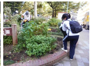
10月29日(土)(株)巴商会の皆さんは秋の植え替えにもボランティアで参加くださいました。若い皆さんの参加は本当に助かります！ありがとうございます。