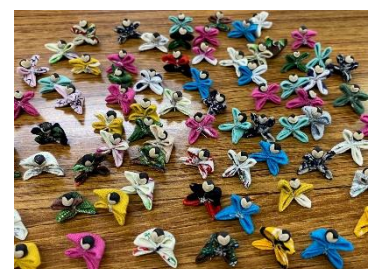
縁側クラフト名物「さるぼっこ」 スタッフの手作りです。

<今月の会員だよりの同封物> ◆活動カレンダー ◆活動アンケート(会員のみ) ◆「みどりの縁側」だより 12月号 ◆せせらぎセミナーチラシ