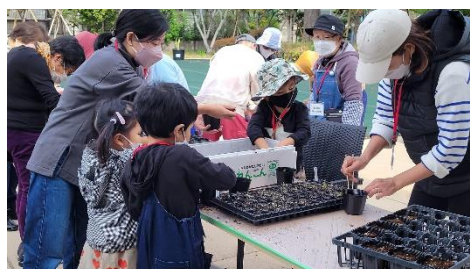
10月30日(日)森ヶ崎緑華園ガーデン講座。花苗ポット上げしました。