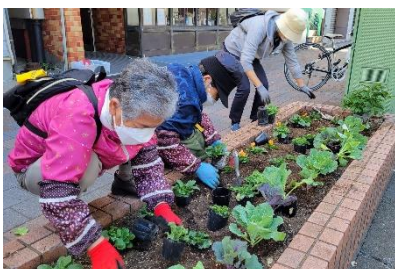
11月4日(金)蒲田駅西口花壇 植替え風景。お疲れ様です！